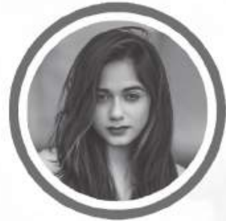
Ms. Jannat Zubair Rahmani