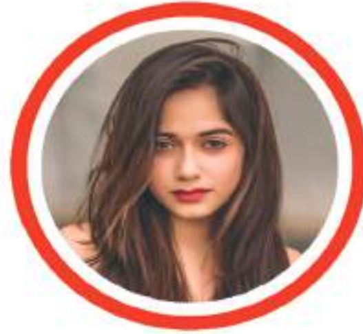
Ms. Jannat Zubair Rahmani

We are pleased to announce that Ms. Shivangi Joshi & Ms. Jannat Zubair Rahmani will be joining us for the Inauguration of the store.