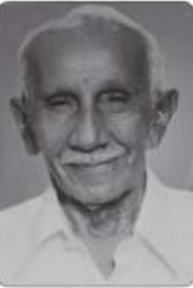
માતુશ્રી લાડુબેન સવજી કારા ગાલા